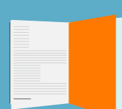
PÁGINA INTERIOR IMPAR