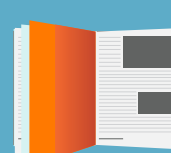
PÁGINA INTERIOR PAR